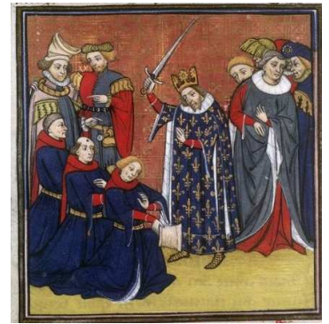
Jean II adoubant des chevaliers, Enluminure des XIVe / XVe siècle, BNF

Le premier devoir des chevaliers étaient de se battre pour leur seigneur.