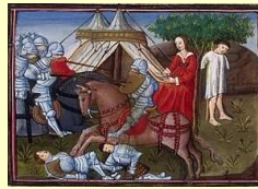
Yvain secourant la damoiselle. Enluminure tirée d'une version de Lancelot du Lac du XVe siècle.