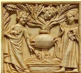
Tristan et Iseult à la fontaine