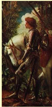
Représentation romantique de Galaad Tableau de George Frederick Watts (1888).