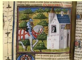
Perceval à la Recluserie, illustration d'un manuscrit de Poitiers du XVe siècle, Bibliothèque nationale de France