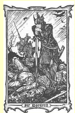
Le Prince Mordred