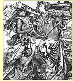
Kay brisant son épée lors d'un tournoi de Howard Pyle (1902)