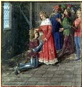
Adoubement de Lancelot du Lac