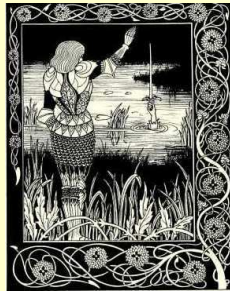
Bedivere rendant Excalibur à la Dame du lac