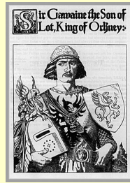
Sir Gauvain (Howard Pyle)