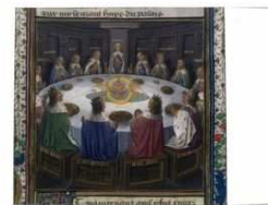
La table ronde