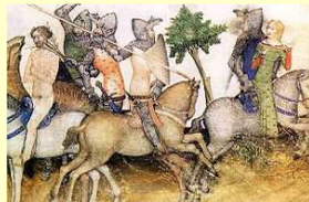
Le dilemme de Bohort.