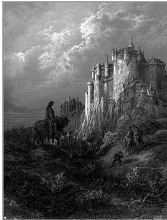
illustration par Gustave Doré de Camelot, dans Les Idylles du Roi , d'Alfred Tennyson, 1868

Un donjon est construit au centre de la cour. Il sert de refuge au seigneur et à sa famille en cas de combat et contient les trésors du seigneur. On entre dans le château par un pont-levis qui peut être baissé et relevé. La herse est abaissée en cas d'attaque. Sur le haut des murs, il y a des créneaux pour que les soldats puissent tirer sur les ennemis. Il y avait aussi des meurtrières, ouvertures étroites par lesquelles les archers tiraient leurs flèches sans être vus.