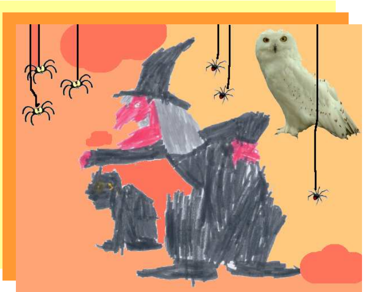
La sorcière de Steben