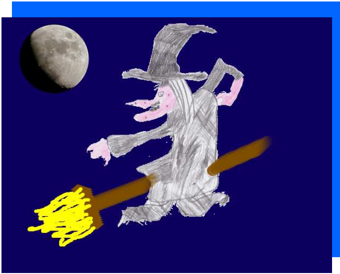
La sorcière d'Océane