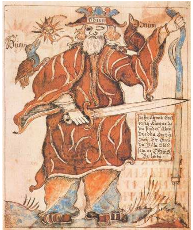
Odin, représenté à la fin du Moyen Age (Royal Library, Copenhagen)