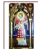
Vielle à roue du XIV e siècle, représentée sur un triptyque du monastère de Piedra à Saragosse.

La vielle : on utilise une manivelle qui frotte les cordes.