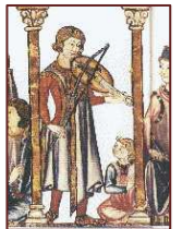
Un joueur de vièle, enluminure tirée des Cantigas de Santa Maria , XIII e siècle

La vièle : Comme le rebec, c'est un ancêtre du violon.