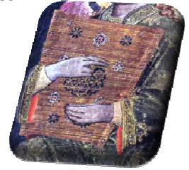
Vierge à l'enfant Turino Vanni Musée du Louvre

Le psaltérion : Les cordes devaient être grattées avec une plume d'oie.